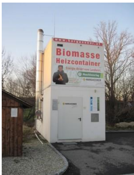
Obr. 2 Lidová škola Weng, Turn - Dvoupatrový kontejner na štěpku, výkon kotle 150 kW

Jako snadné řešení regionálního využívání biomasy jak z pohledu regionu (obce, města) tak z pohledu vlastníků a správců lesa i z pohledu investora, jako smluvního dodavatele tepla lze považovat řešení pomocí topných kontejnerů. Topné kontejnery jsou ideální kombinace řešení topení a skladovacího prostoru. Podle požadavku zákazníka mohou být topné kontejnery dodány v jednopatrové, dvoupatrové nebo třípatrové variantě. Zákazník ocení především příznivé cenově-stavební možnosti, úsporu místa, zjednodušení přestupu na biomasu a velkou variabilitu výkonů zvolených kotlů, jejich automatizaci a důmyslný plnicí systém. Řešení je ideální pro veřejné budovy, průmyslové závody, hotely nebo gastronomické a obytné budovy.