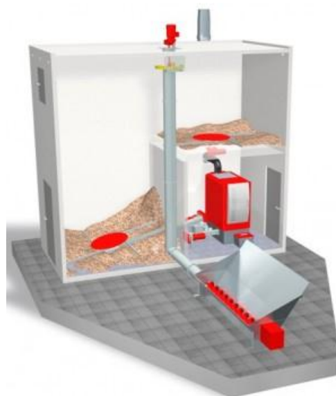
Obr. 3 Řez dvoupatrovým topným kontejnerem